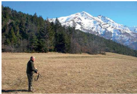
Zone de tir

Il est primordial de toujours maîtriser son environnement et de garantir la sécurité de chaque utilisateur de cet espace.