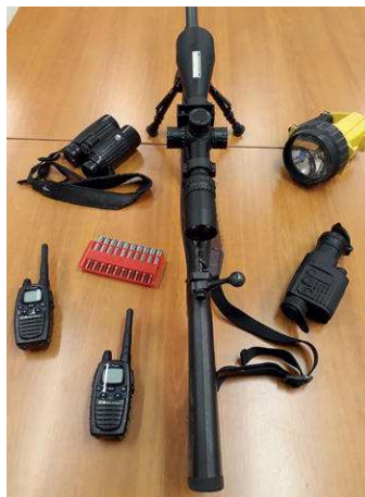
Vérification préalable du matériel

Pour les armes lisses, l'emploi des balles ou des munitions avec des grenailles d'un diamètre supérieur à 3,5 mm en munition magnum et avec un canon full choke est conseillé. Pour des raisons de sécurité et de balistique, l'emploi de chevrotines est à proscrire.