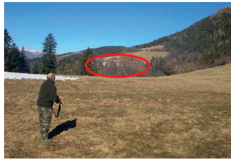
Zone d'exclusion de tir (habitations)