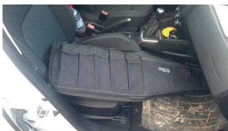
Franchissement d'obstacle : arme sécurisée (déchargée, culasse ouverte)