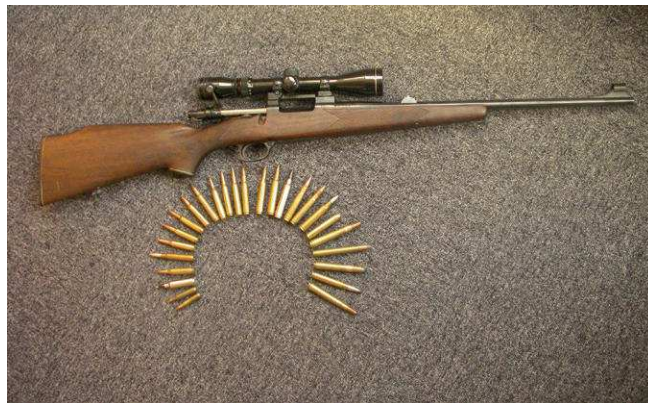
Munitions canons lisses