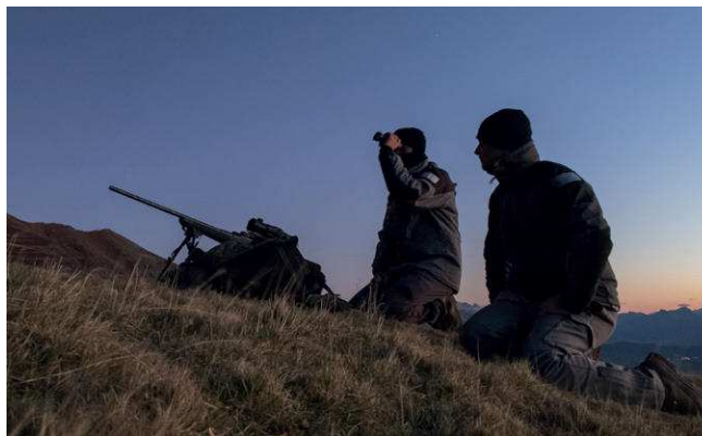
Détermination des distances de tirs avec un télémètre