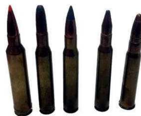
Munitions de grande chasse > 7 mm